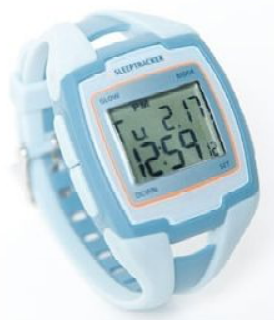
スリープトラッカー 24,480円(税込)

右の2つとも、手首にはめて、睡眠中の腕の振りを計測し、それをPCで管理できるというものです。正確かどうかは?というところです。